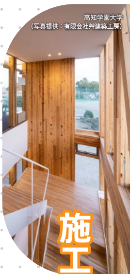
高知学園大学 (写真提供: 有限会社仲建築工房)