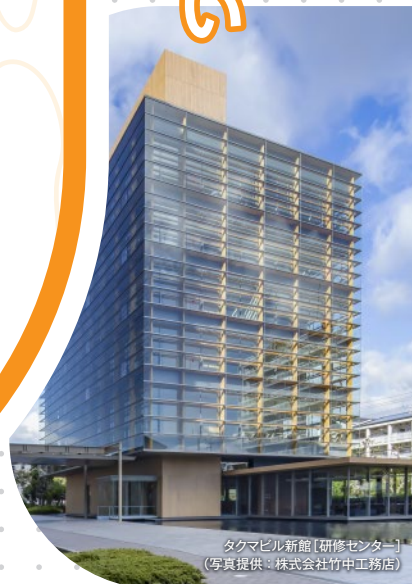
タクマビル新館 [研修センター]