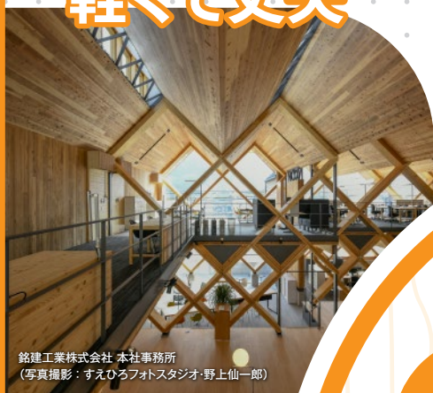
銘建工業株式会社 本社事務所