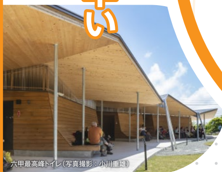
六甲最高峰トイレ